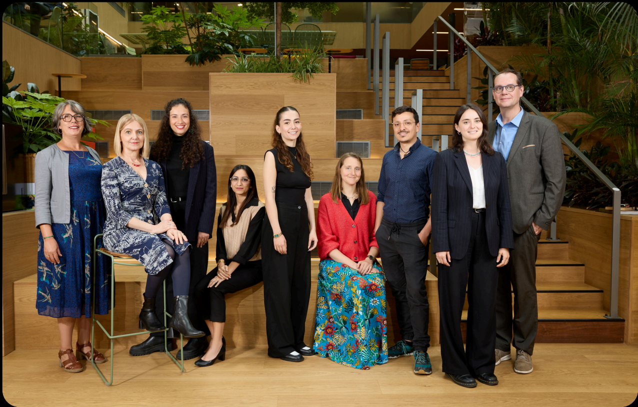
Foto del equipo 2BS

La evolución continua está en nuestro ADN. Es por esto que trabajamos de la mano con expertos del mundo agrícola para desarrollar especificaciones que cumplan no sólo con los requisitos regulatorios sino también con la realidad sobre el terreno.